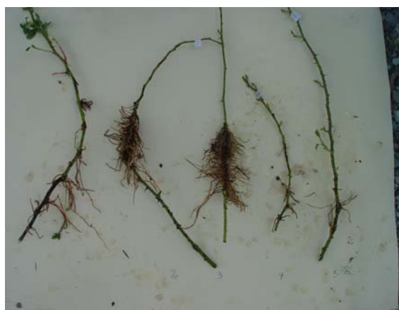
شکل ۳- ریشه‌زایی در پاییز، به ترتیب از چپ به راست: ۱- شاهد، ۲- IBA= ۵۰ ppm، ۳- IBA= ۱۰۰ ppm، ۴- NAA= ۵۰ ppm، ۵- NAA= ۱۰۰ ppm

تقسیم سلولی کمک نموده و سبب تحریک ریشه‌زایی و پیدایش ریشه‌ها می‌شوند. بنابراین تولید ریشه به شرایط فیزیولوژیکی، فصلی و عوامل محیطی اطراف گیاه مربوط می‌شود. در این آزمایش در هر پنج تیمار شاهد، IBA (۵۰ و ۱۰۰ میلی‌گرم در لیتر) و NAA (۵۰ و ۱۰۰ میلی‌گرم در