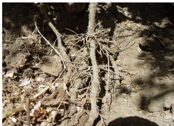
شکل ۴- ریشه‌زایی در زمستان IBA= ۵۰ ppm