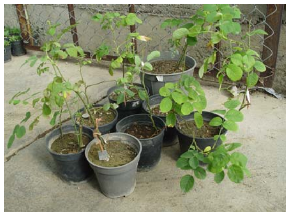
شکل ۵- استقرار گیاهچه‌های گل محمدی