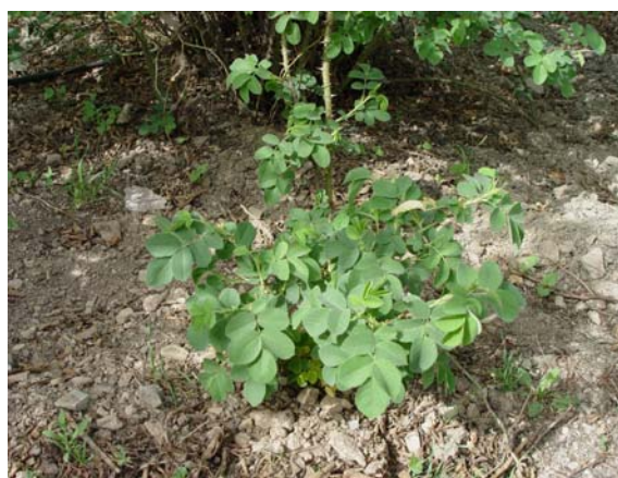
شکل ۲- خوابانیدن شاخه‌های گل محمدی (ژنوتیپ اصفهان ۱) جهت ریشه‌زایی