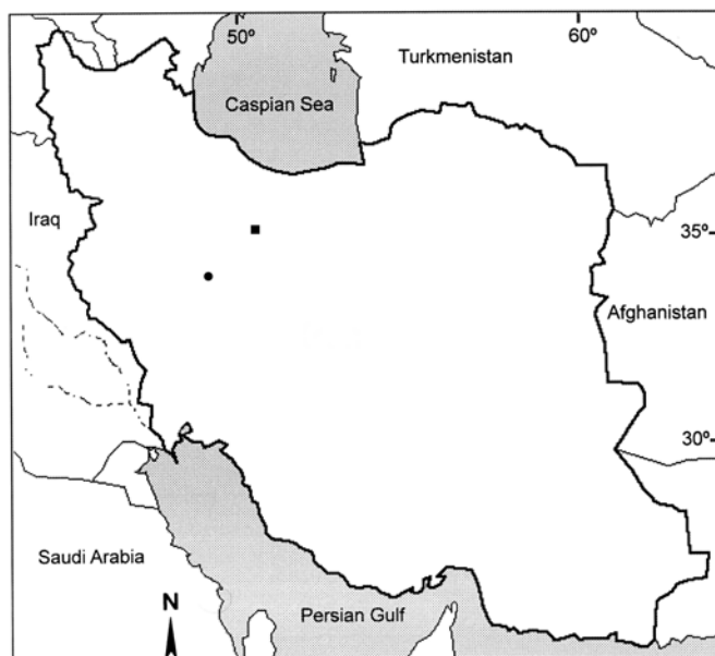
شکل ۱- مرکز پراکنش گیاه کاکوتی در حصارک (کرج) و ونارچ (قم).

در منطقه ونارچ قم معدن منگنز می‌باشد و غلظت عناصری مانند منگنز و آهن در خاک منطقه بالا می‌باشد. با توجه به این که منگنز و آهن از عناصر سنگین می‌باشند در پژوهش حاضر محتوای اسانس و اثر ضدباکتریایی عصاره کاکوتی منطقه ونارچ با گیاه کاکوتی رشدیافته در منطقه حصارک کرج مقایسه شده است.