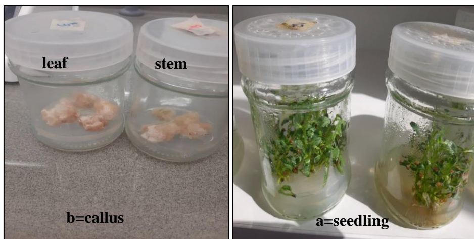
شکل ۱- a: گیاهچه‌های تولید شده بعد از ۳ هفته کشت بذور گیاه پنیرباد ( Withania coagulans ) در محیط ۱/۲MS و b: کالوس‌های تولید شده از ریزنمونه‌های برگ و ساقه گیاه پنیرباد در محیط MS محتوی اکسین و سیتوکنین

آزمایش به صورت طرح کاملاً تصادفی با سه تکرار انجام شد. تیمارها شامل تیمار ۱: شاهد (فاقد الیسیاتور سلولاز)؛ تیمار ۲، ۳ و ۴ شامل: اضافه کردن الیسیاتور سلولاز به