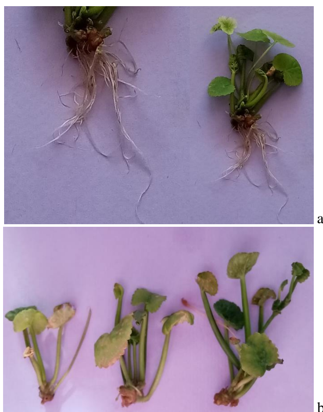
شکل ۳- a: ریشه‌زایی شاخساره‌های حاصل از کشت درون‌شیشه‌ای آب‌شقبایی ( Centella asiatica )

در محیط MS حاوی ۱ میلی‌گرم بر لیتر IBA و b: عدم تشکیل ریشه در محیط فاقد تنظیم‌کننده‌های رشد گیاهی