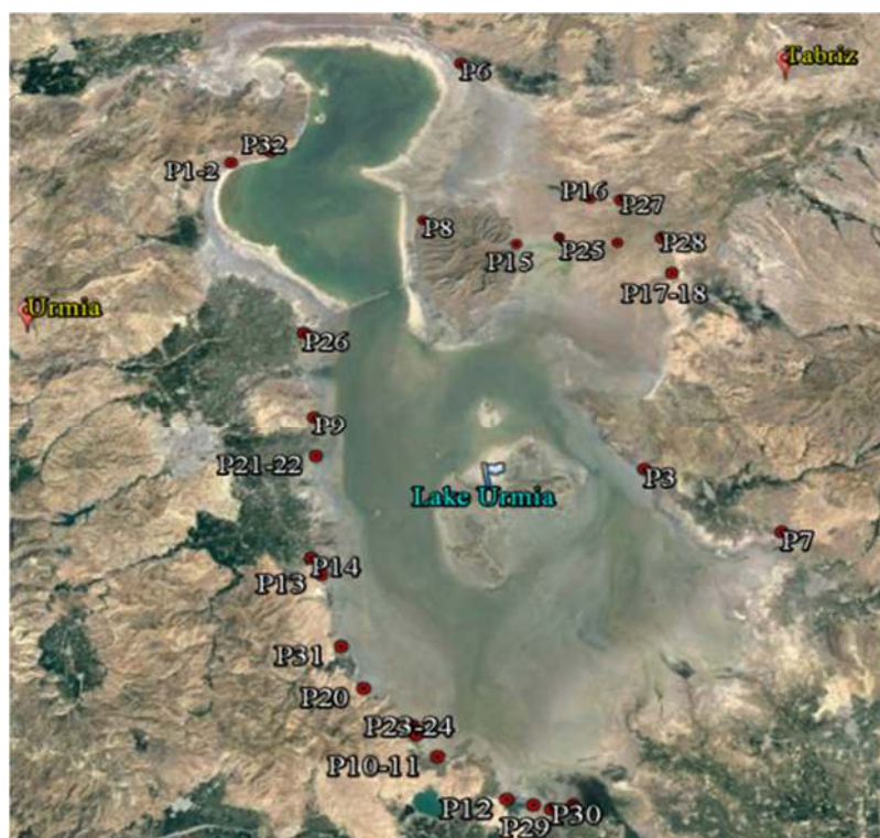
شکل ۱- مناطق جمع‌آوری جمعیت‌های مختلف سالیکورنیای اطراف دریاچه ارومیه

رادیکال آزاد DPPH به‌وسیله آنتی‌اکسیدان‌ها در غیاب سایر رادیکال‌های آزاد در محیط می‌باشد و نتیجه این عمل باعث ایجاد رنگی در محیط می‌شود که شدت آن در طول موج ۵۱۷ نانومتر با دستگاه اسپکتروفتومتر قابل اندازه‌گیری است. برای اندازه‌گیری ظرفیت آنتی‌اکسیدانی، از سرشاخه‌های هر بوته یک نمونه مرکب به وزن یک گرم توزین و در داخل هاون ریخته شد. سپس با مقدار ۱۰ میلی‌لیتر متانول ۸۰٪ عصاره‌گیری و به مدت پنج دقیقه سانتی‌فیوژ (۱۰۰۰ دور در دقیقه) شده و از محلول رویی برای اندازه‌گیری استفاده گردید. آنگاه ۳۰ میکرولیتر از عصاره تهیه شده را برداشته و به آن دو میلی‌لیتر از محلول DPPH اضافه شد و در نهایت جذب نمونه‌ها با دستگاه اسپکتروفتومتر قرائت گردید و فعالیت آنتی‌اکسیدانی عصاره‌های گیاهی از رابطه زیر محاسبه شد (Lakshmi et al. , 2015).