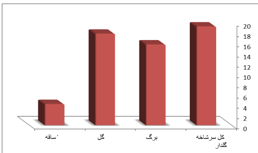
شکل ۳- مقایسه مقدار ترکیب کامفور در اسانس سرشاخه گلدار، گل، برگ و ساقه Achillea vermicularis

- صابر آملی، س.، ناصری، ا.، رحمانی، غ.ح. و کالیراد، ع.، ۱۳۸۳. گیاهان دارویی استان کرمان. تحقیقات گیاهان دارویی و معطر ایران، ۲۰(۴): ۴۸۷-۵۳۲.