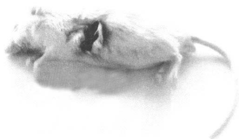
ج- زخم نکروزه وسیع

تصویر ۱- ضایعات متنوع در محل تزریق داخل جلدی استافیلوکوکوس اورئوس در موش آزمایشگاهی.