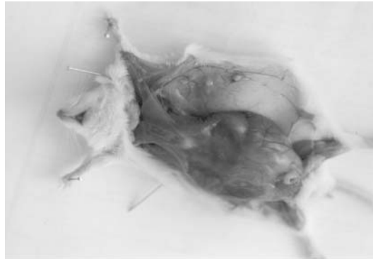
تصویر ۲- کانون چرکی در زیر پوست در محل تزریق استافیلوکوکوس اورئوس بعد از تشریح موش در روز هشتم

موشها در روز هشتم بعد از کشتن، تشریح شدند. تصویر ۲ کانون چرکی در محل تزریق بعد از تشریح را نشان می‌دهد.