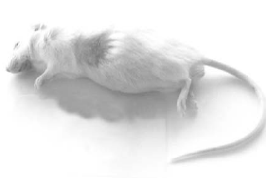
الف- ضایعه خفیف