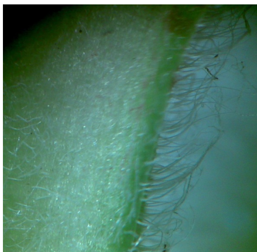
دمبرگ گیاه مامیران در مناطق با ارتفاع بالا

همان‌طور که بیان شد هدف از این مقاله، تعیین مقدار کمی برخی از آلکالوئیدها در نواحی مورد مطالعه و بررسی عامل ارتفاع در میزان این ترکیب‌هاست. گیاه مامیران در رویشگاه‌های مختلف مورد مطالعه، با تغییرات عوامل محیطی تغییرات ظاهری متفاوتی می‌یابد. عواملی مثل عرض جغرافیایی، طول جغرافیایی و ارتفاع محل