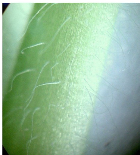
دمبرگ گیاه مامیران در مناطق با ارتفاع پایین