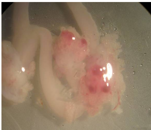
شکل ۲- نمای تخمدان و فولیکول‌های موش‌های صحرائی گروه کنترل مثبت اول (فولیکول‌های رسیده و پرخون بر روی تخمدان مشاهده می‌شود).