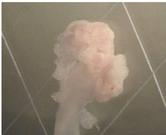
شکل ۱- نمای تخمدان و فولیکول‌های موش‌های صحرائی نابالغ گروه شاهد (بر روی تخمدان فولیکول بالغ و رسیده مشاهده نمی‌شود).