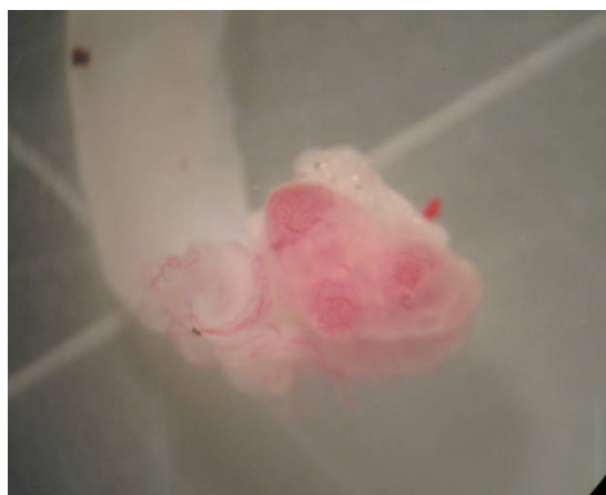
شکل ۳- نمای تخمدان و فولیکول‌های موش‌های صحرائی گروه کنترل مثبت سوم (فولیکول رسیده و پرخون بر روی تخمدان مشاهده می‌شود).