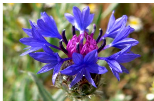
شکل ۱- گیاه Centaurea depressa