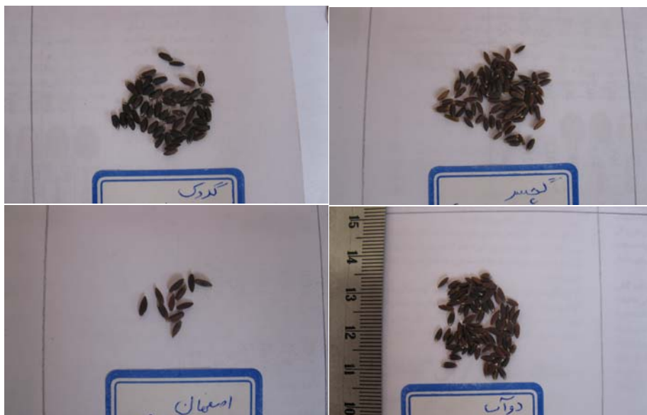
شکل ۴- بذره‌های جمع‌آوری شده از مناطق مختلف