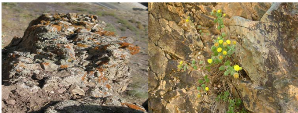
شکل ۲- نمایی از پتانما گیاه همراه غالب با بادرنجبویه دنیایی و فراوانی گل‌سنگ‌ها در مناطق پراکنش این گیاه (در این رابطه می‌توان از این گیاهان به‌عنوان نشانگر برای پیدا کردن بادرنجبویه دنیایی استفاده نمود).

*: مناطقی که اعداد مربوط به خصوصیات اقلیمی با خصوصیات اقلیمی مناطق همجوار بدست آمده‌است.