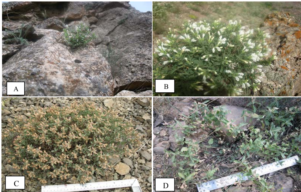
شکل ۳- نمایی از مراحل مختلف فنولوژیکی در گیاه بادرنجبویه دنايي؛ مرحله آغاز گلدهی (A)، مرحله گلدهی کامل (B)، مرحله بذردهی (C)، رشد جوانه‌های جدید از طوقه (D)