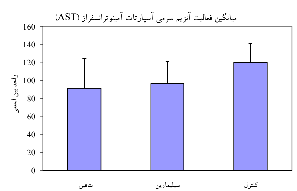
شکل ۱- تغییرات سطح AST (آسپاراتات آمینوترانسفراز) در ماهیان تحت تیمارهای مورد بررسی طی ۶۰ روز

- حروف همسان عدم اختلاف معنی‌دار و حروف غیرهمسان اختلاف معنی‌دار در سطح اطمینان ۹۵٪ است.