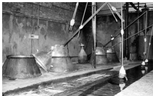
شکل ۱- نمونه ای از یک کارگاه گلابگری سنتی در کاشان

آشنایی دارد. به علت مشکلات کیفی شامل عدم یکنواختی رنگ، ترکیبهای شیمیایی، ویژگیهای بهداشتی و بسته‌بندی بازار آن دچار نوسان شده است.